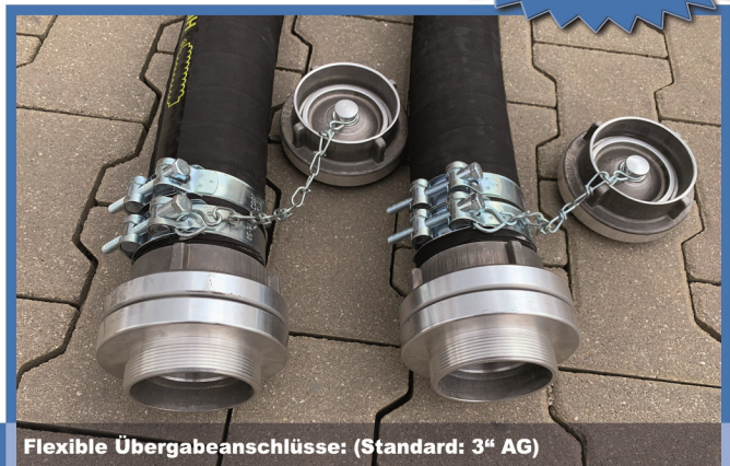
Flexible Übergabeanschlüsse: (Standard: 3" AG)